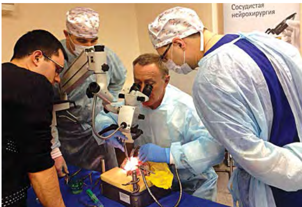
Объяснение последовательности выполнения арахноидальной диссекции при доступе к интракраниальной аневризме во время мастер-класса по хирургии аневризм головного мозга